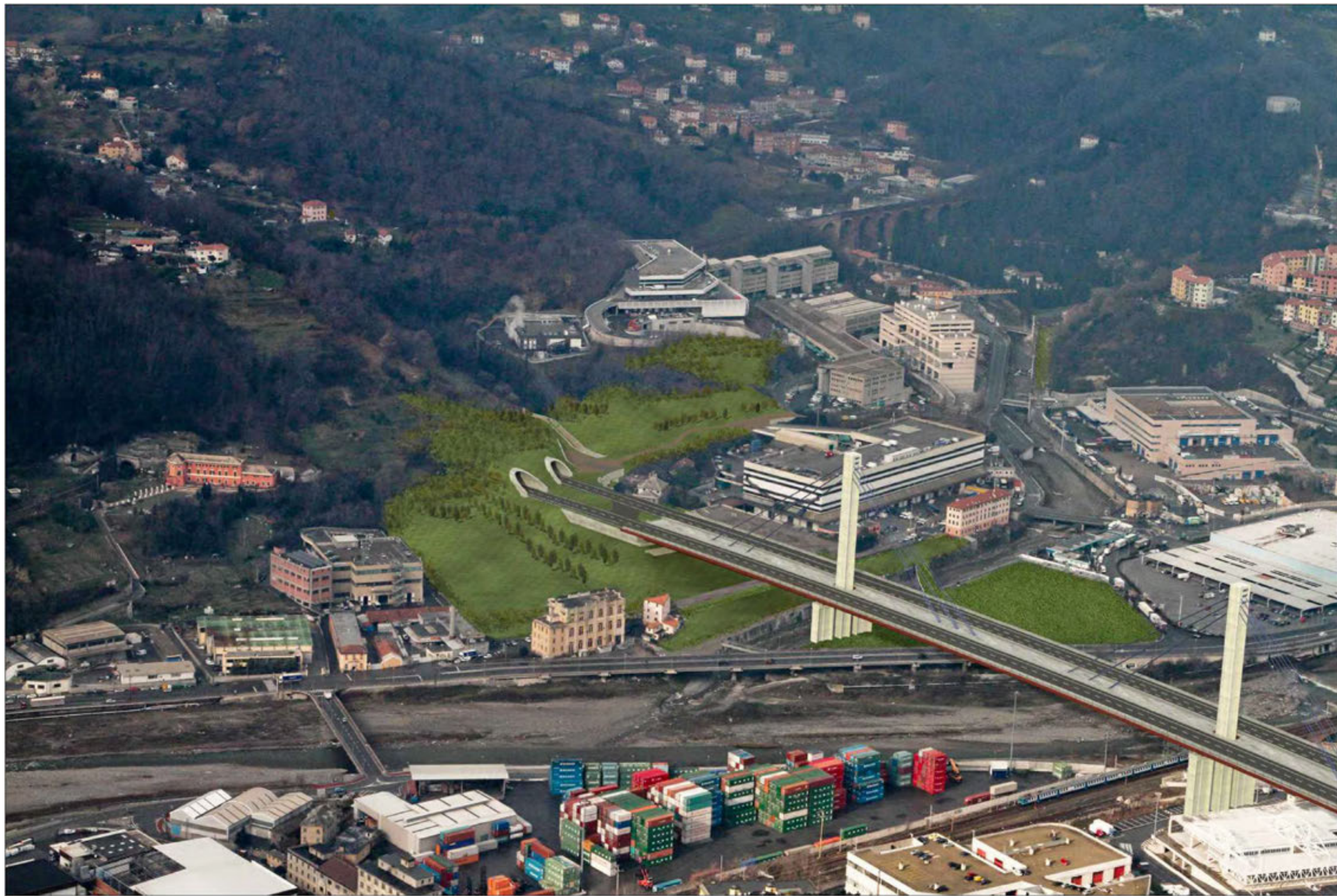
Galleria Monterosso imbocco lato Genova Crescita della vegetazione di progetto - simulazione progettuale