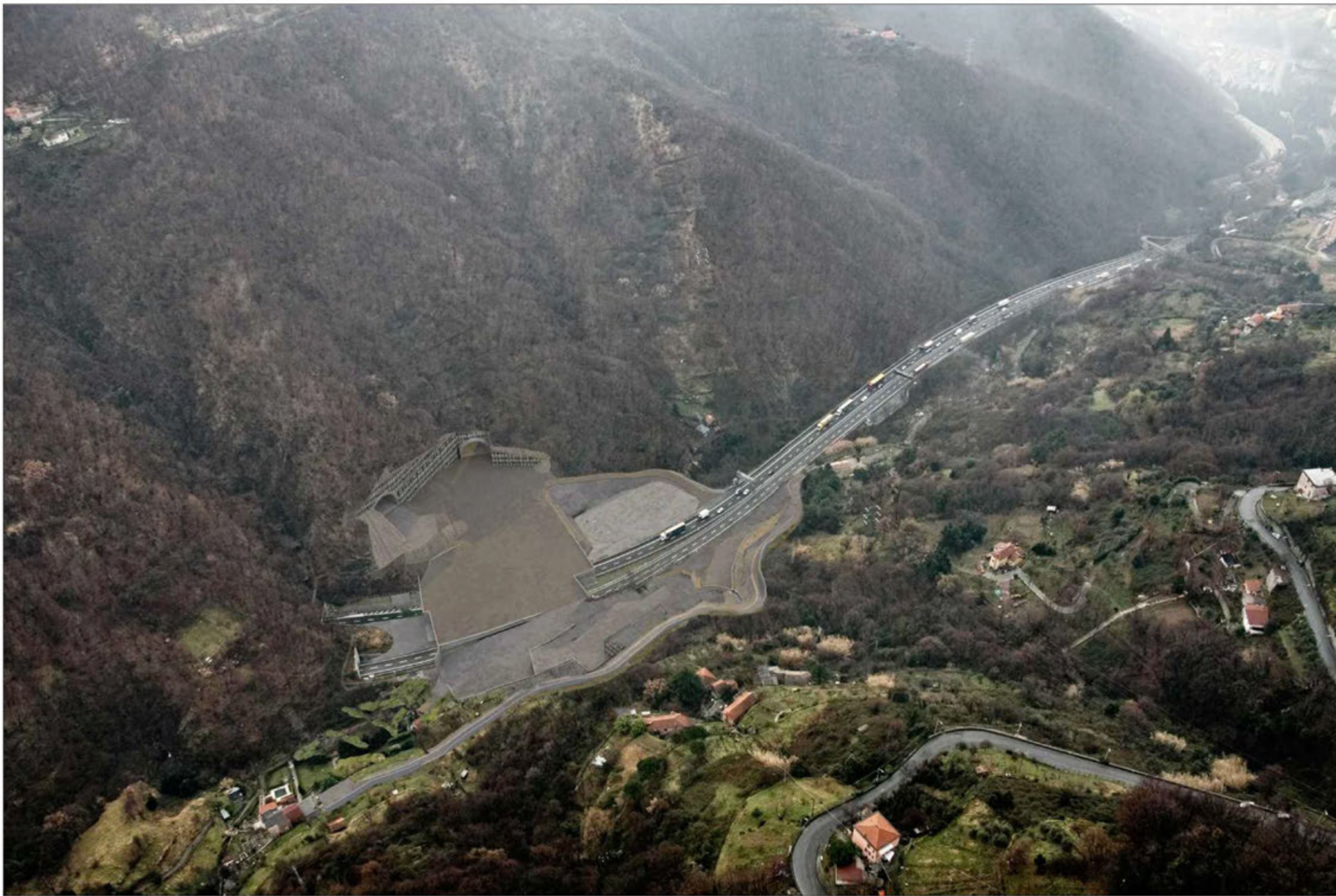
Gallerie Granarolo - Monte Sperone imbocchi lato nord Fase di cantiere - simulazione progettuale