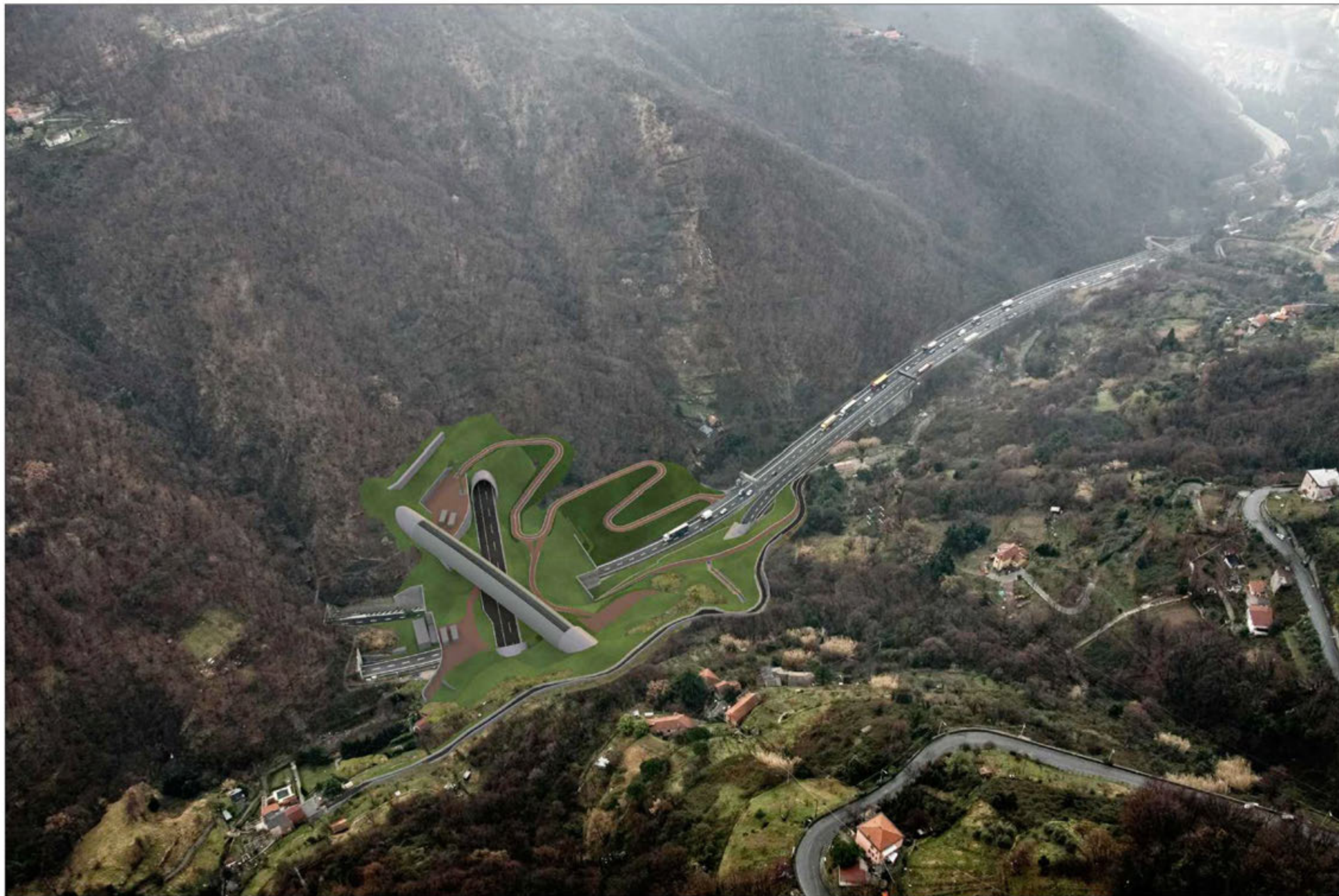
Gallerie Granarolo - Monte Sperone imbocchi lato nord Completamento della sistemazione definitiva - simulazione progettuale