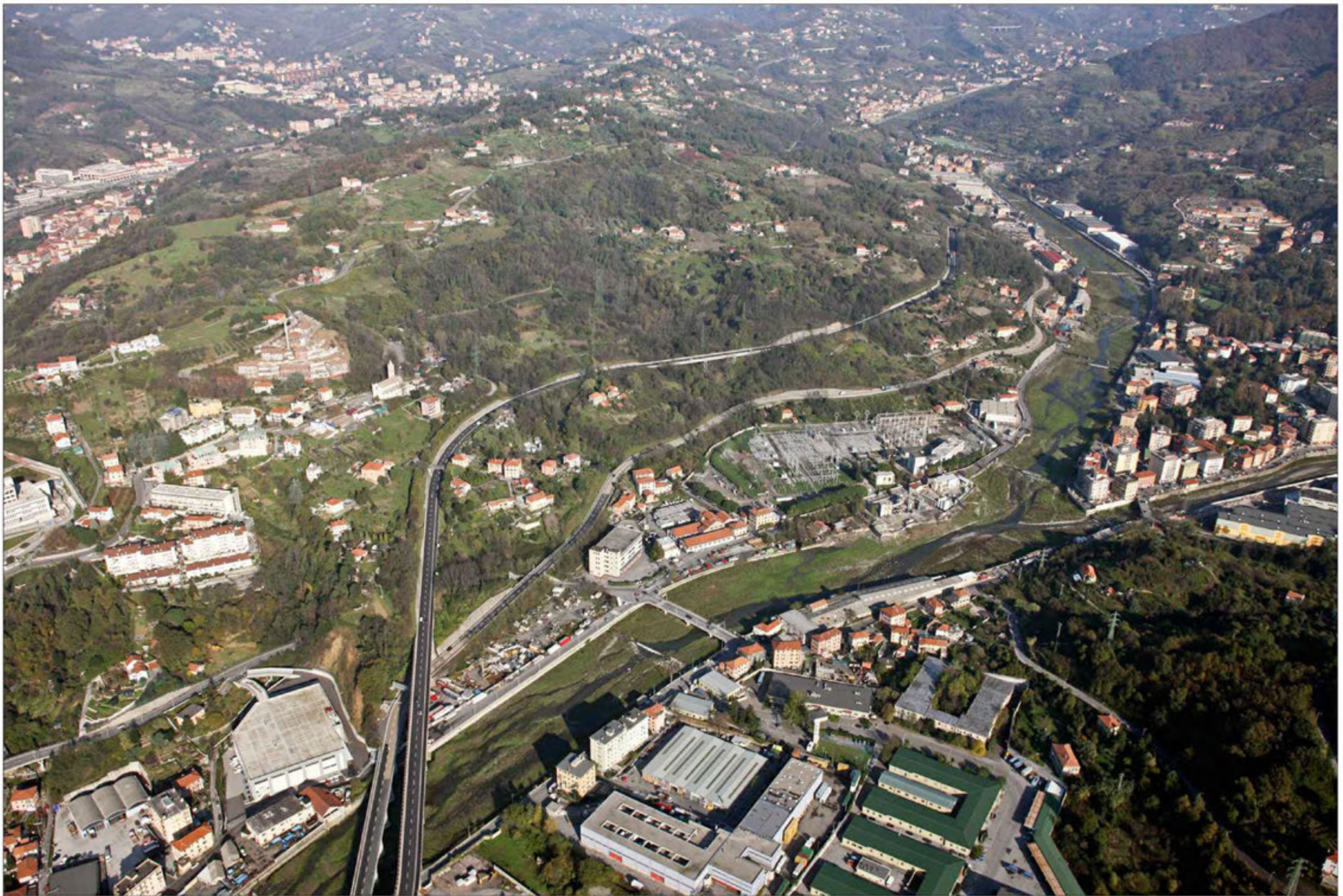
Galleria Morego imbocco lato ovest Stato di fatto