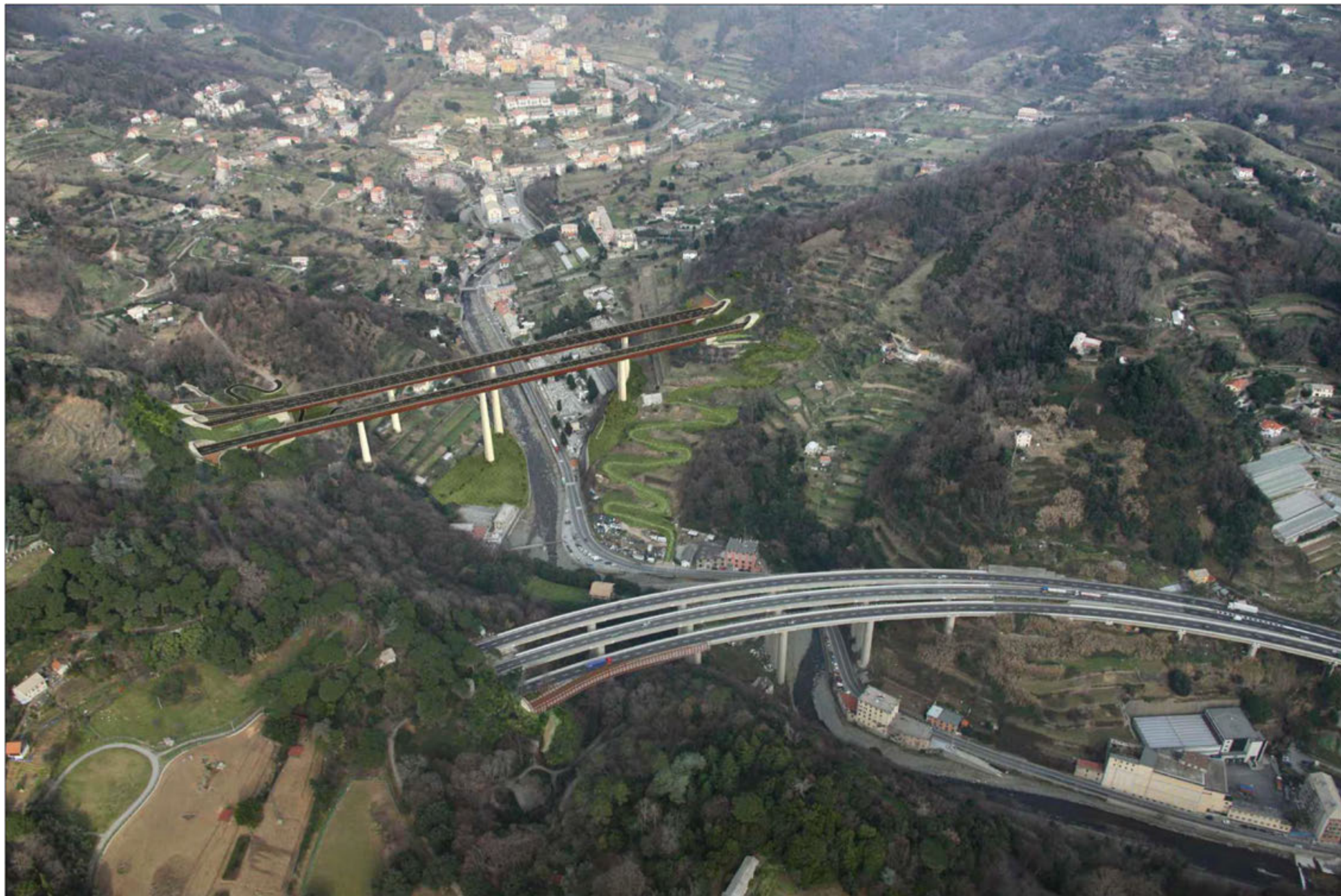
Nuovi viadotti Leiro est e ovest Crescita della vegetazione di progetto - simulazione progettuale