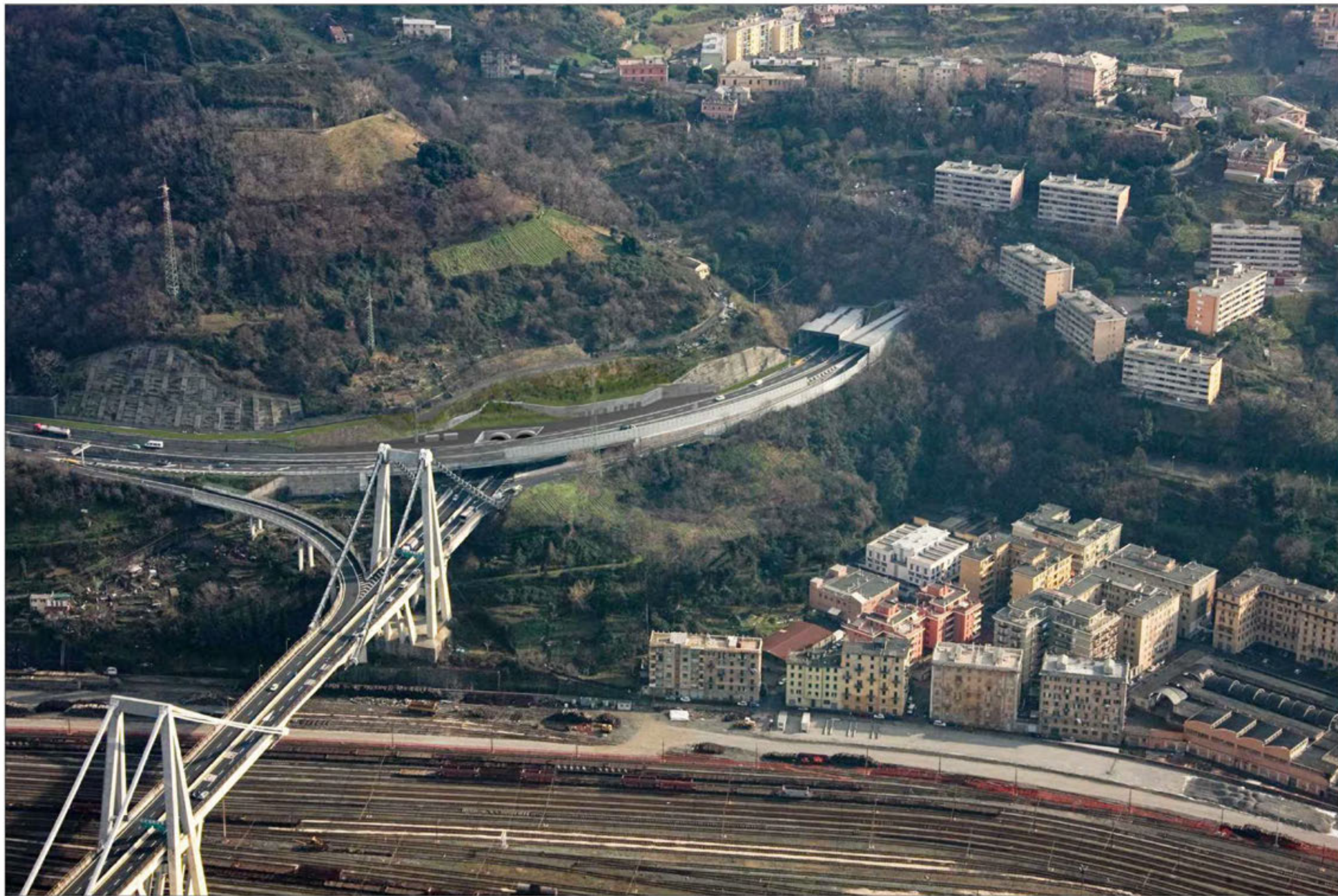
Gallerie Moro 1 - Moro 2 imbocchi lato Savona Crescita della vegetazione di progetto - simulazione progettuale