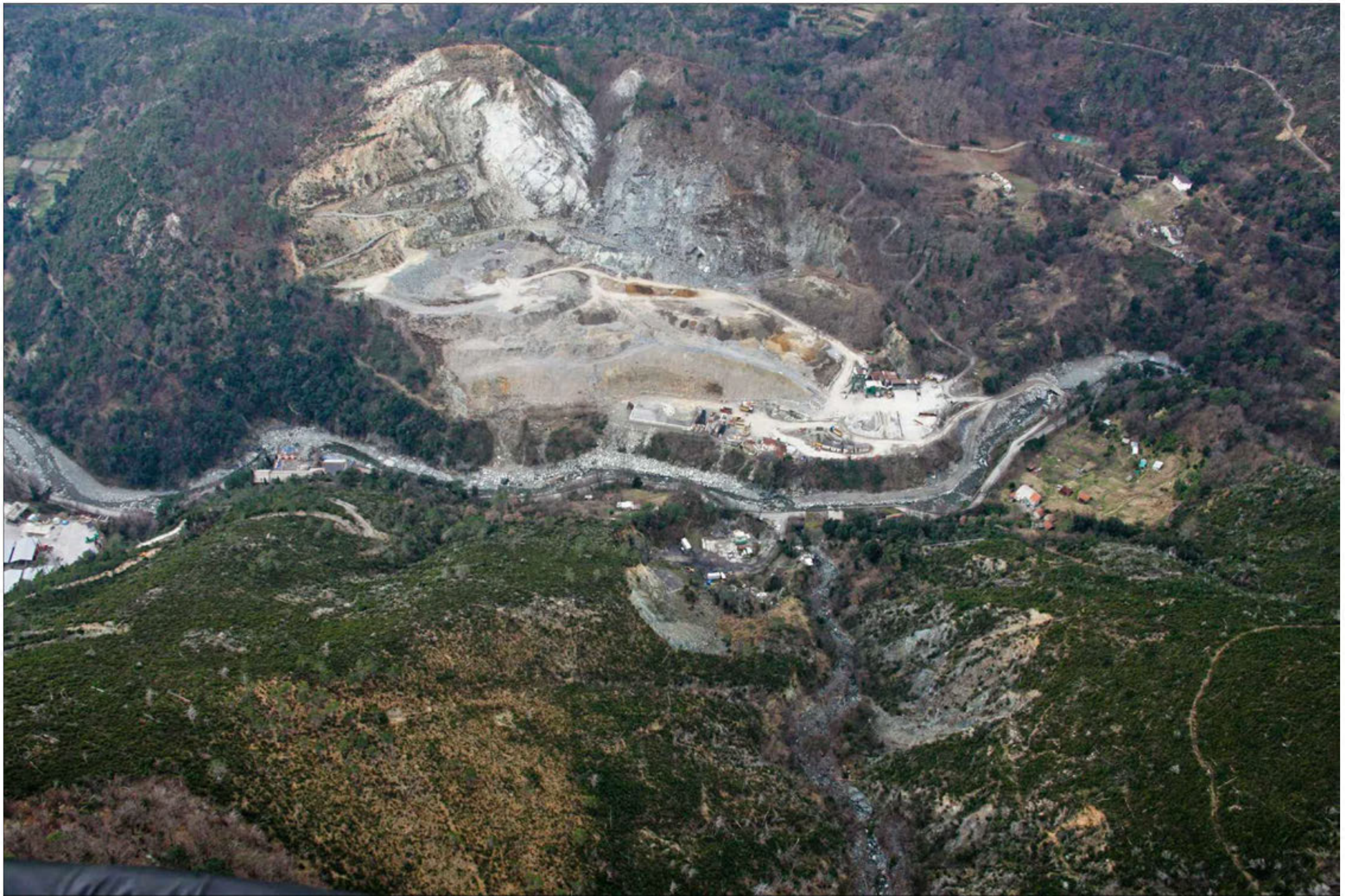
Galleria Amandola imbocco lato Genova Stato di fatto