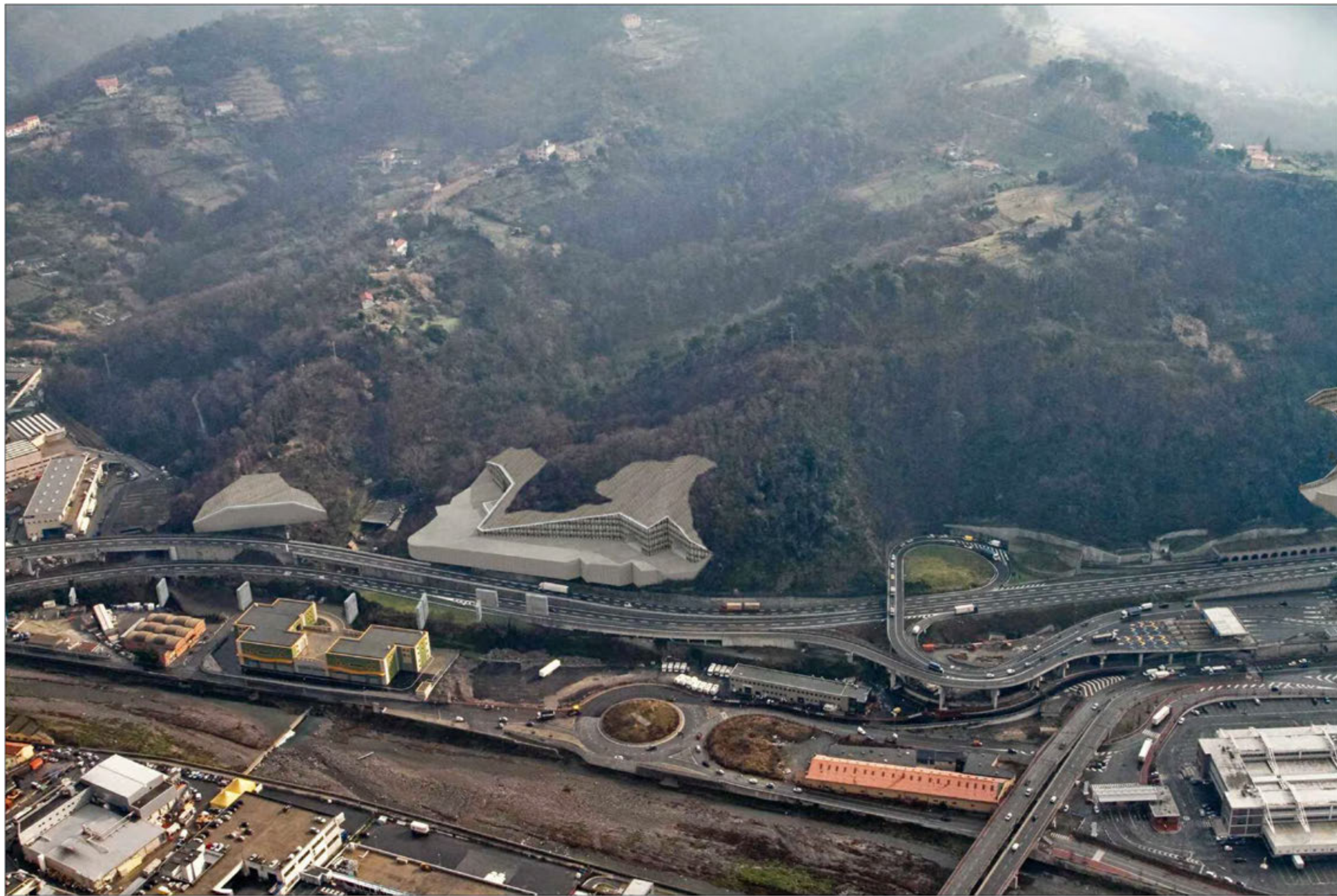
Gallerie Polcevera - San Rocco - Forte diamante imbocchi lato Savona Fase di cantiere - simulazione progettuale