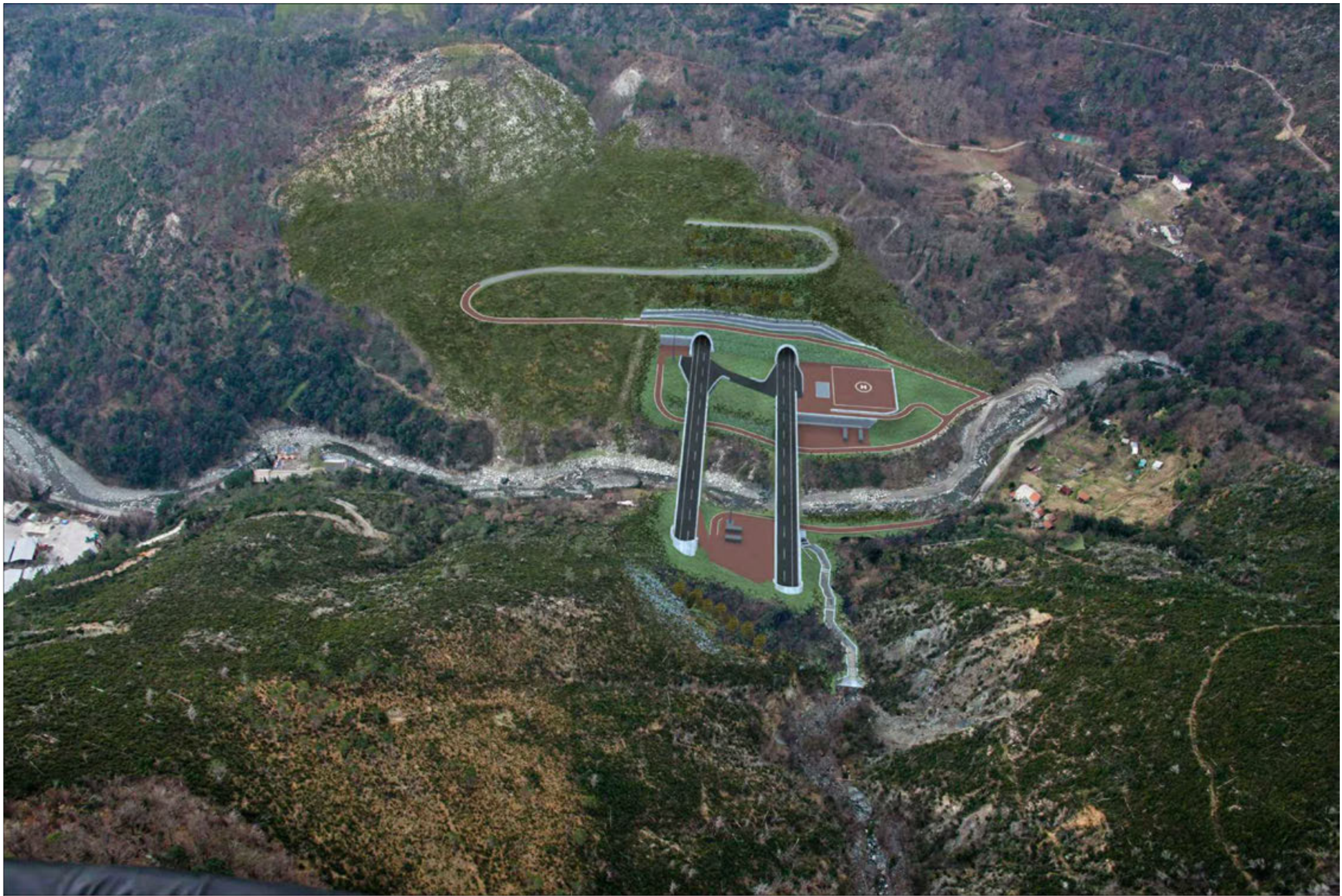
Galleria Amandola imbocco lato Genova Crescita della vegetazione di progetto - simulazione progettuale