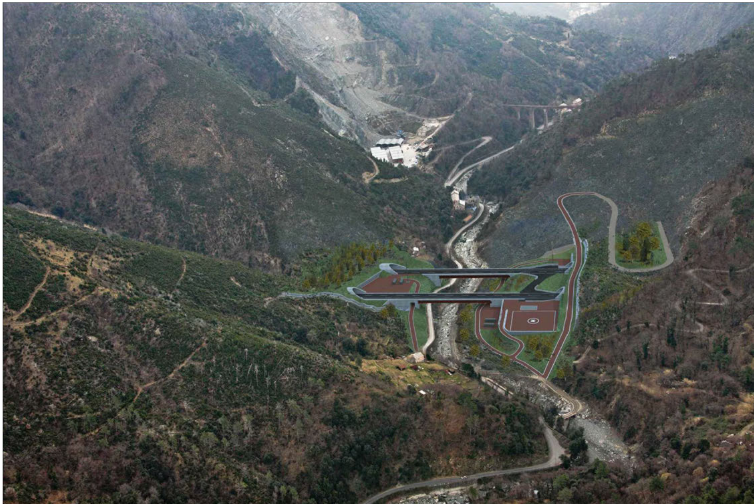
Nuovi viadotti Varenna est e ovest Crescita della vegetazione di progetto - simulazione progettuale