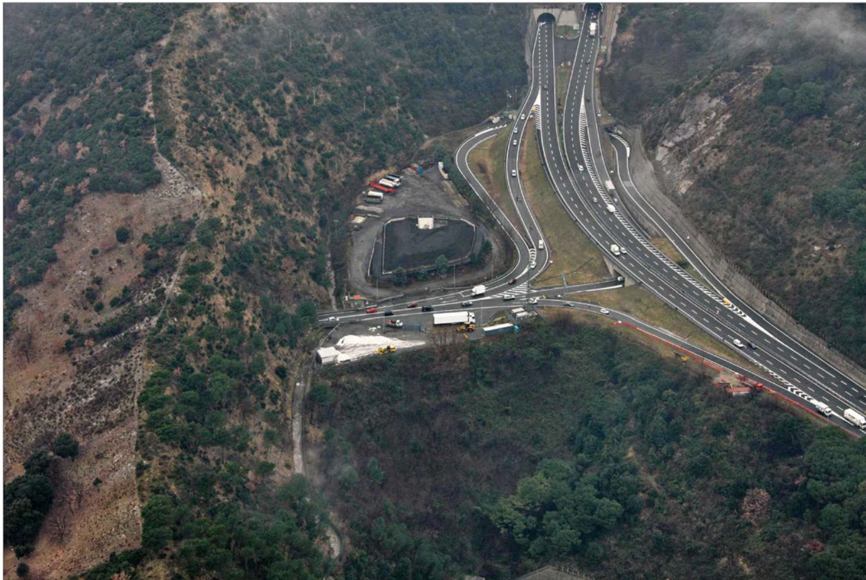
Gallerie Monte Sperone imbocco lato sud - Campursone imbocco lato nord Stato di fatto