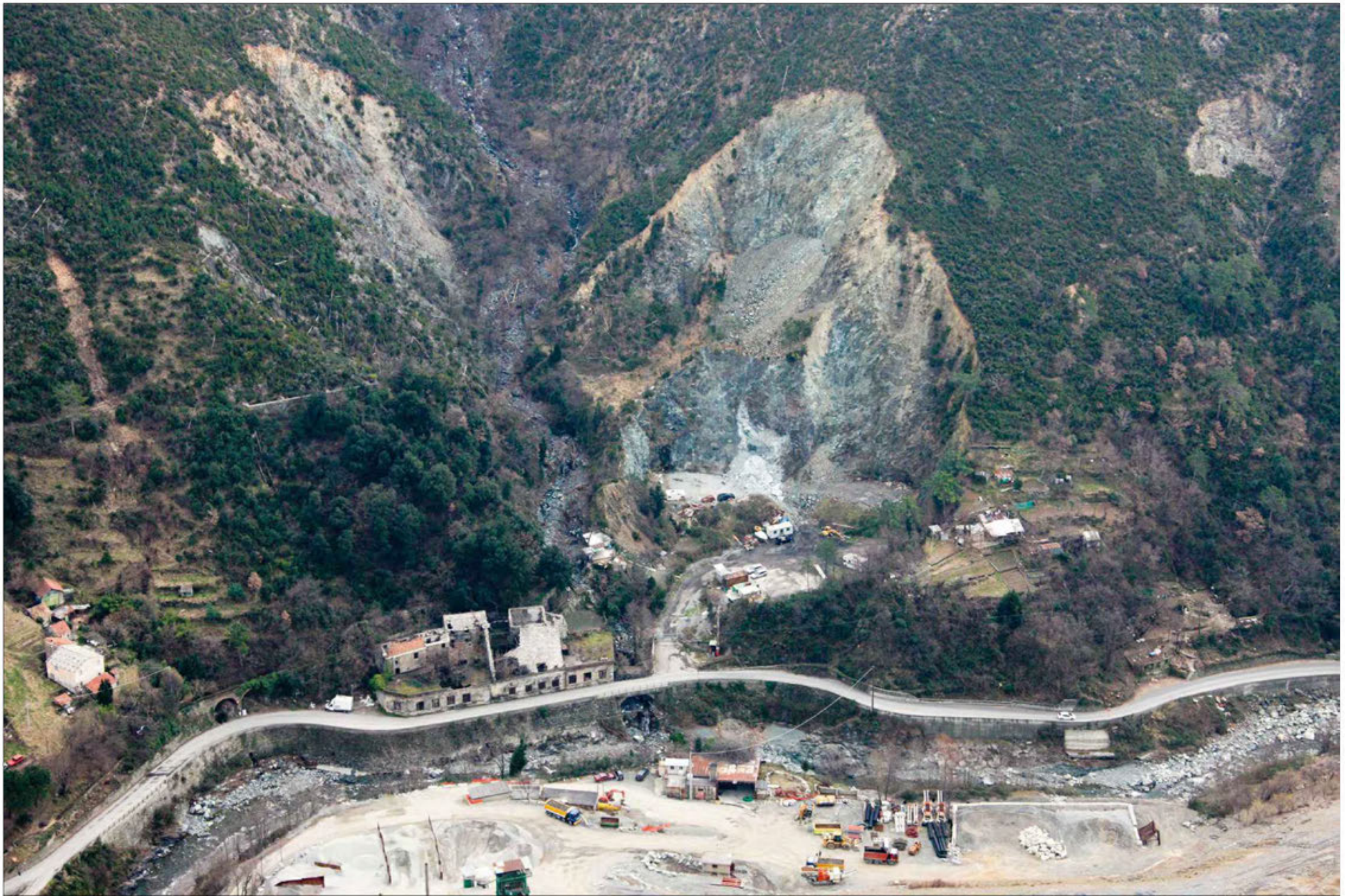
Galleria Monterosso imbocco lato Savona Stato di fatto