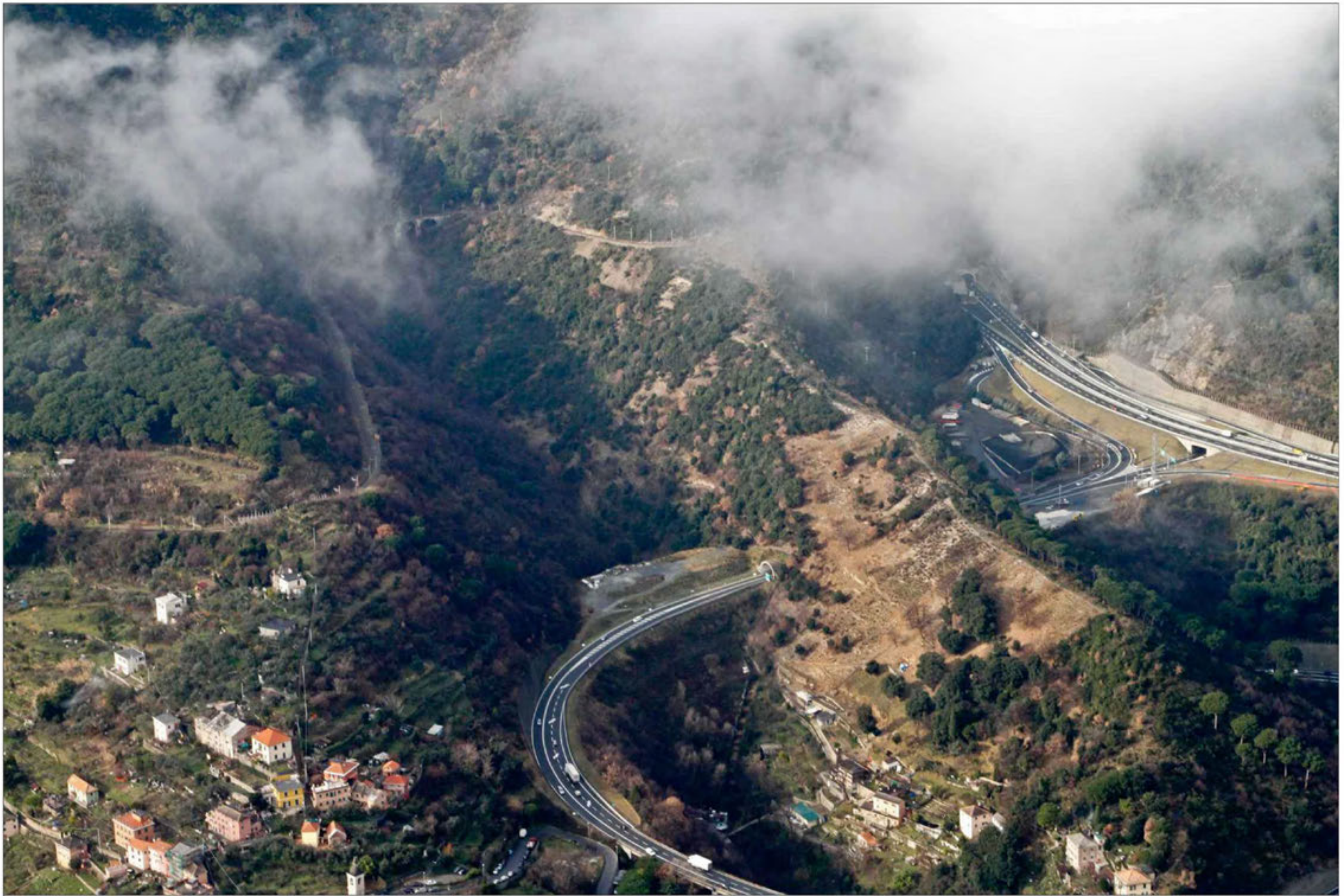
Galleria Campursone imbocco lato sud Stato di fatto