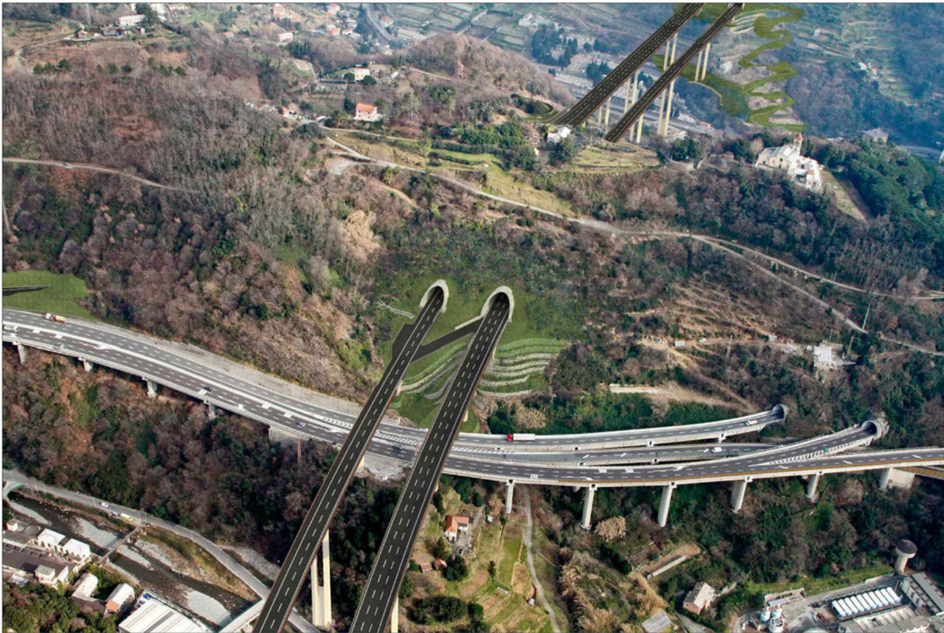
Galleria Voltri imbocco lato Savona Crescita della vegetazione di progetto - simulazione progettuale