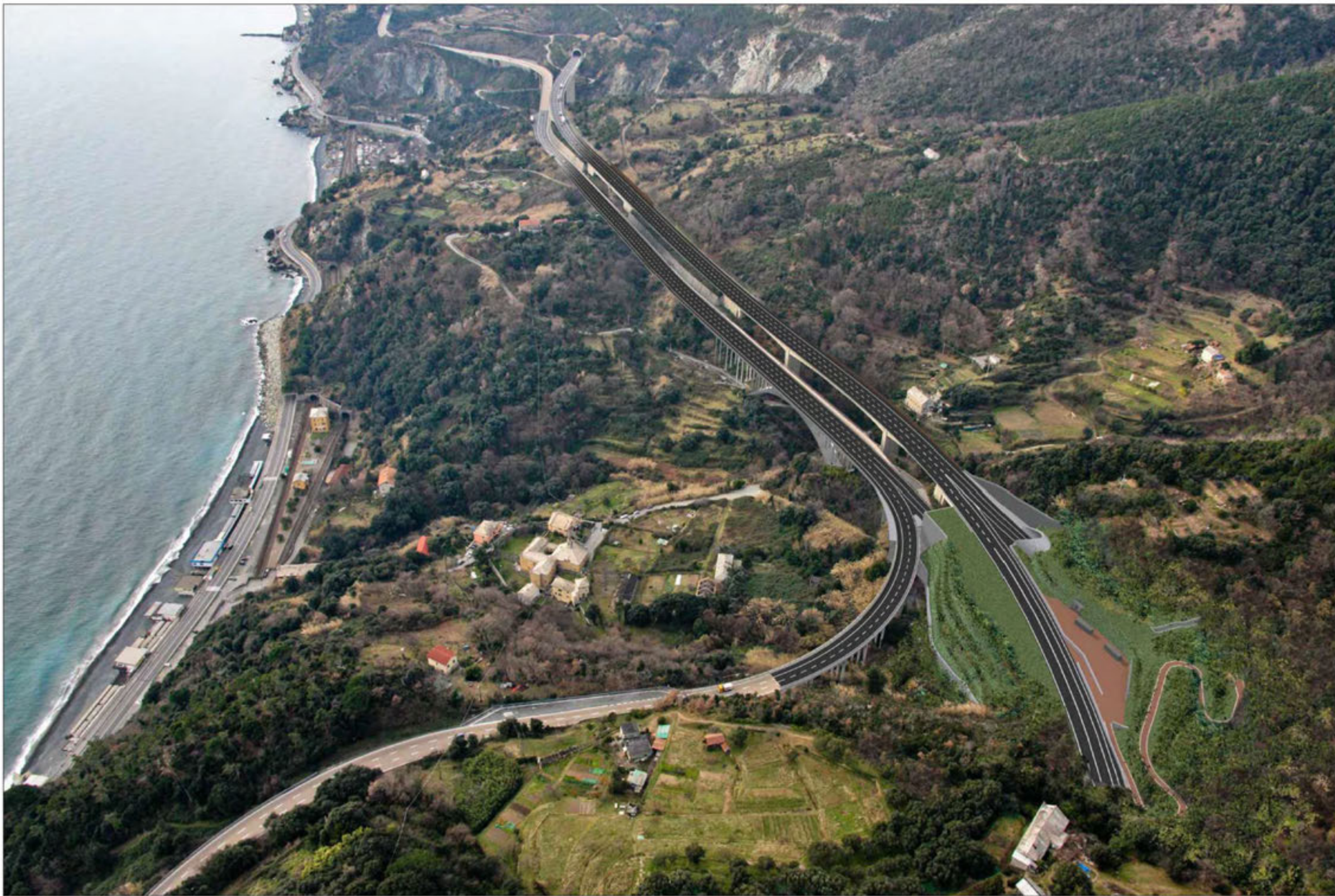
Viadotti Vesima Est-Ovest ampliamento Crescita della vegetazione di progetto - simulazione progettuale