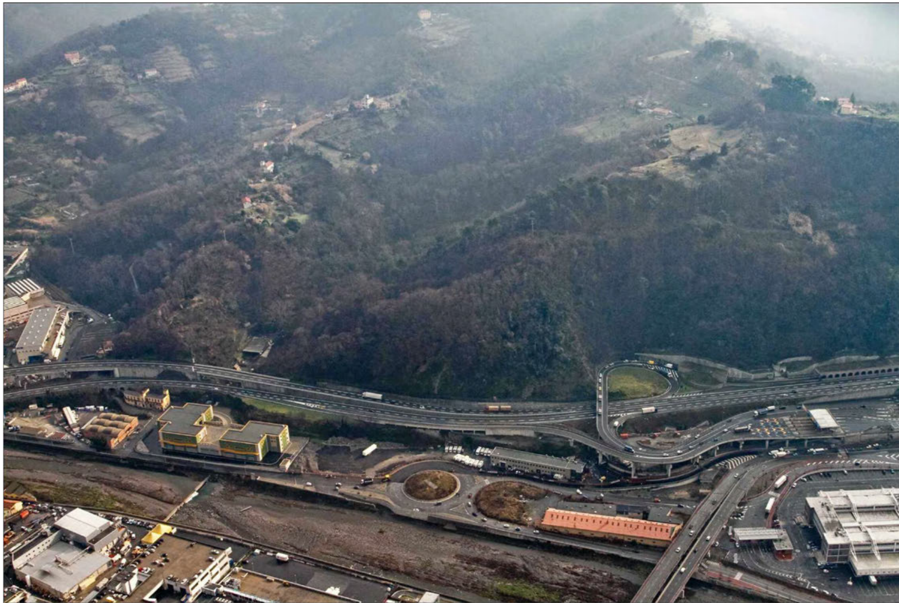
Gallerie Polcevera - San Rocco - Forte diamante imbocchi lato Savona Stato di fatto