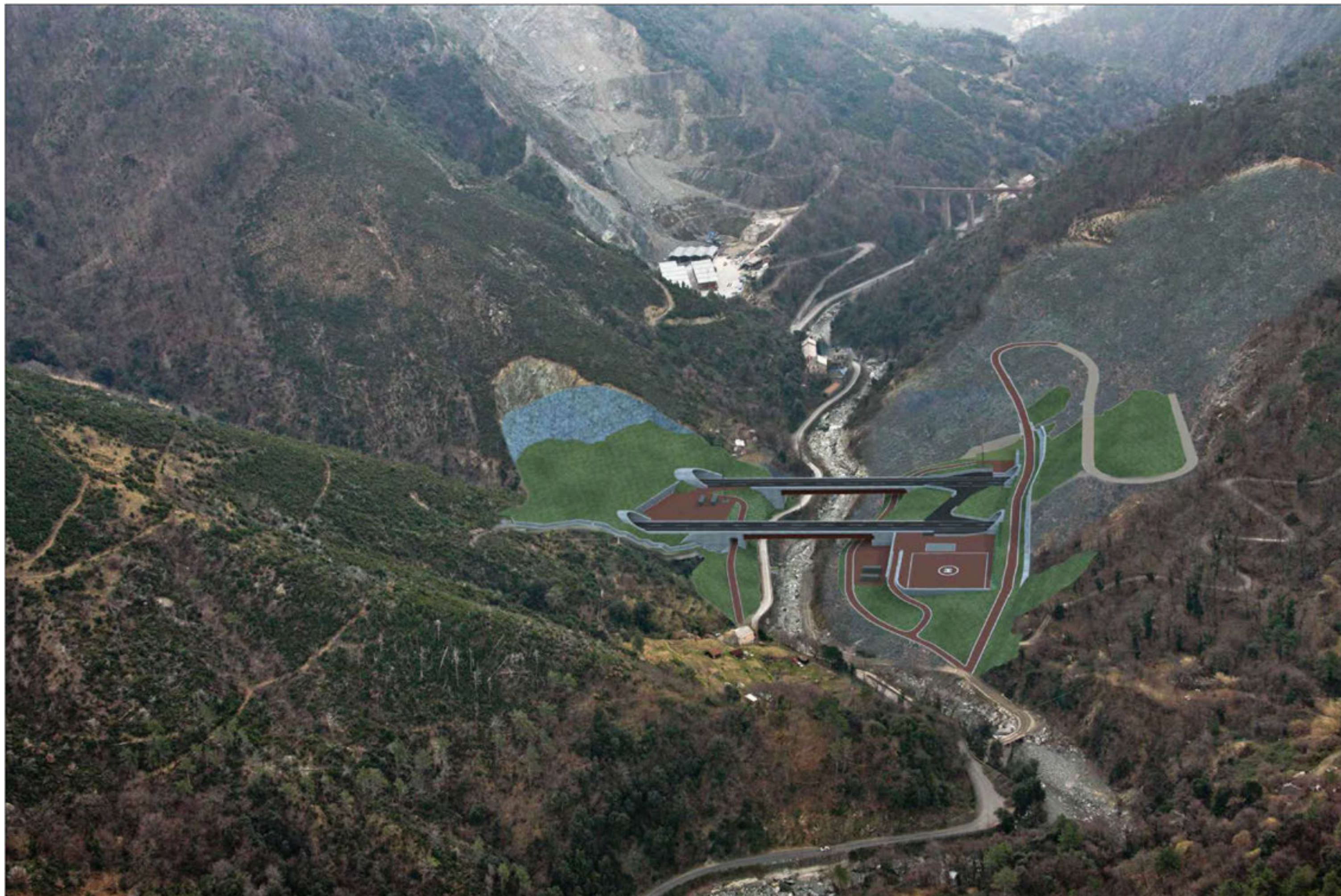
Nuovi viadotti Varenna est e ovest Completamento della sistemazione definitiva - simulazione progettuale