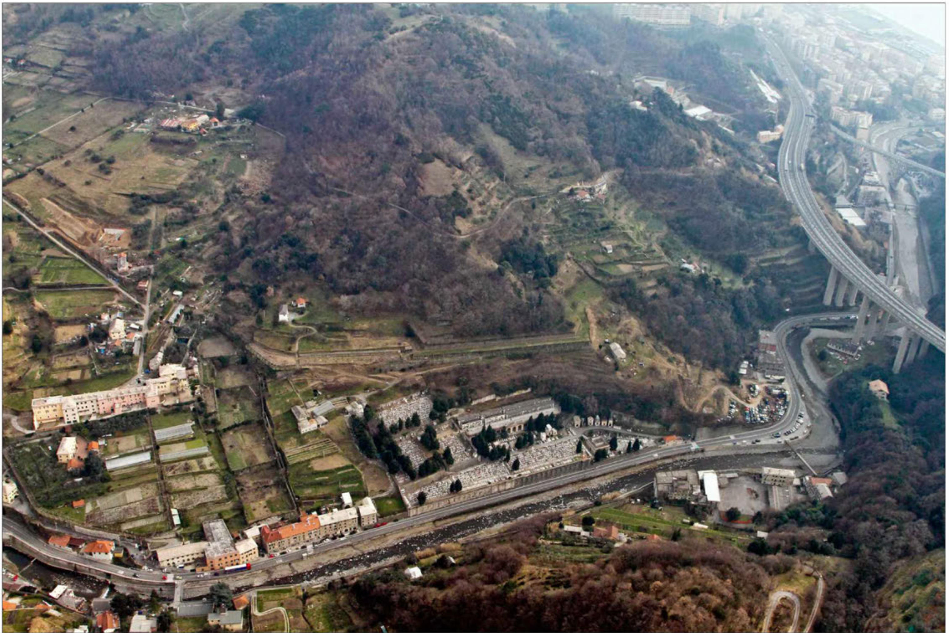
Galleria Amandola imbocco lato Savona Stato di fatto