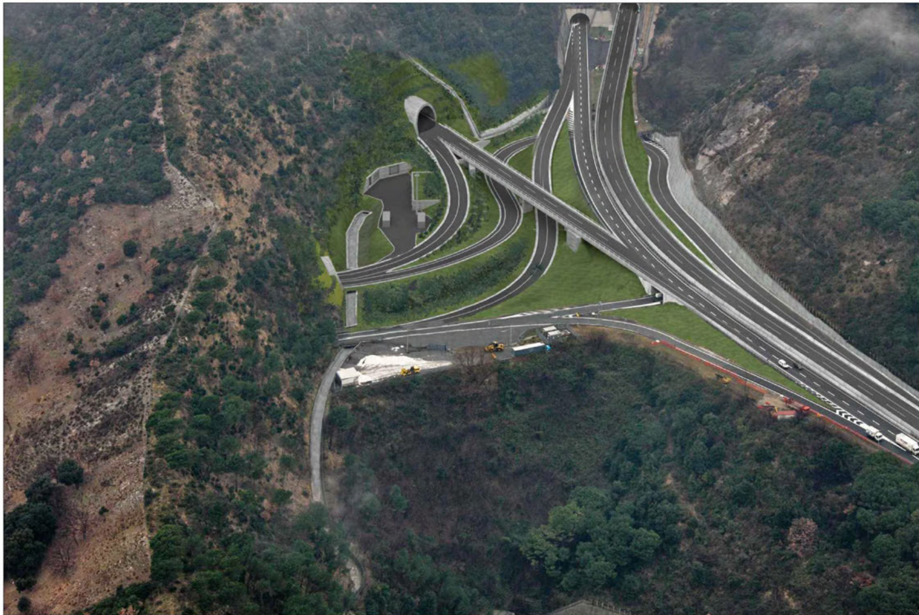
Gallerie Monte Sperone imbocco lato sud - Campursone imbocco lato nord Crescita della vegetazione di progetto - simulazione progettuale