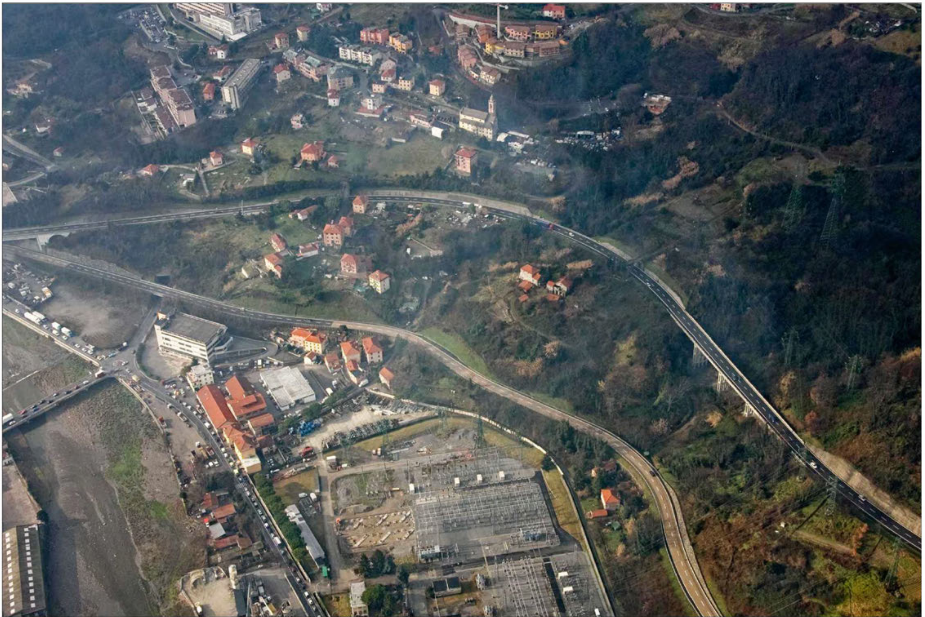
Galleria Morego imbocco lato est Stato di fatto