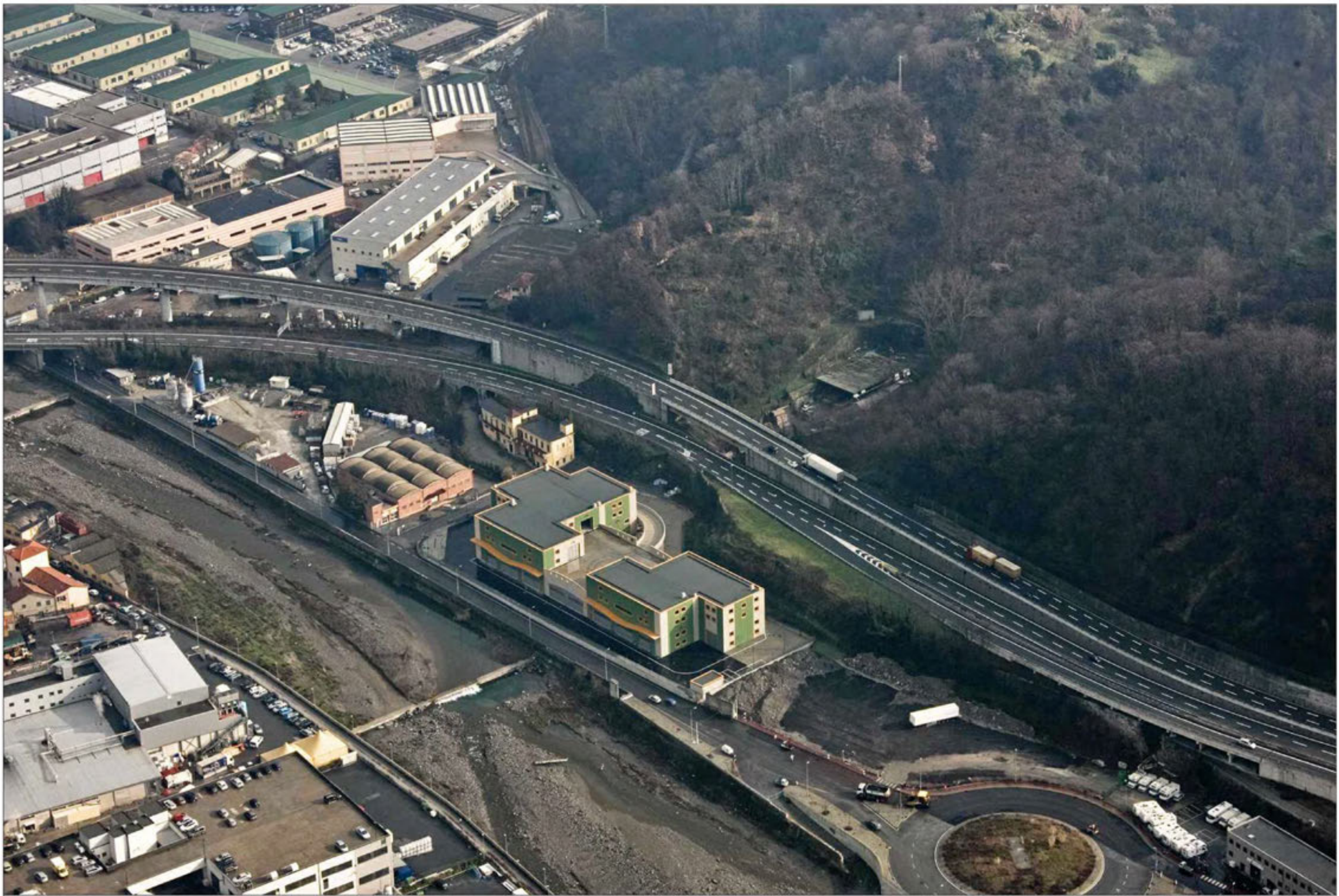
Nuovo viadotto Orpea Stato di fatto