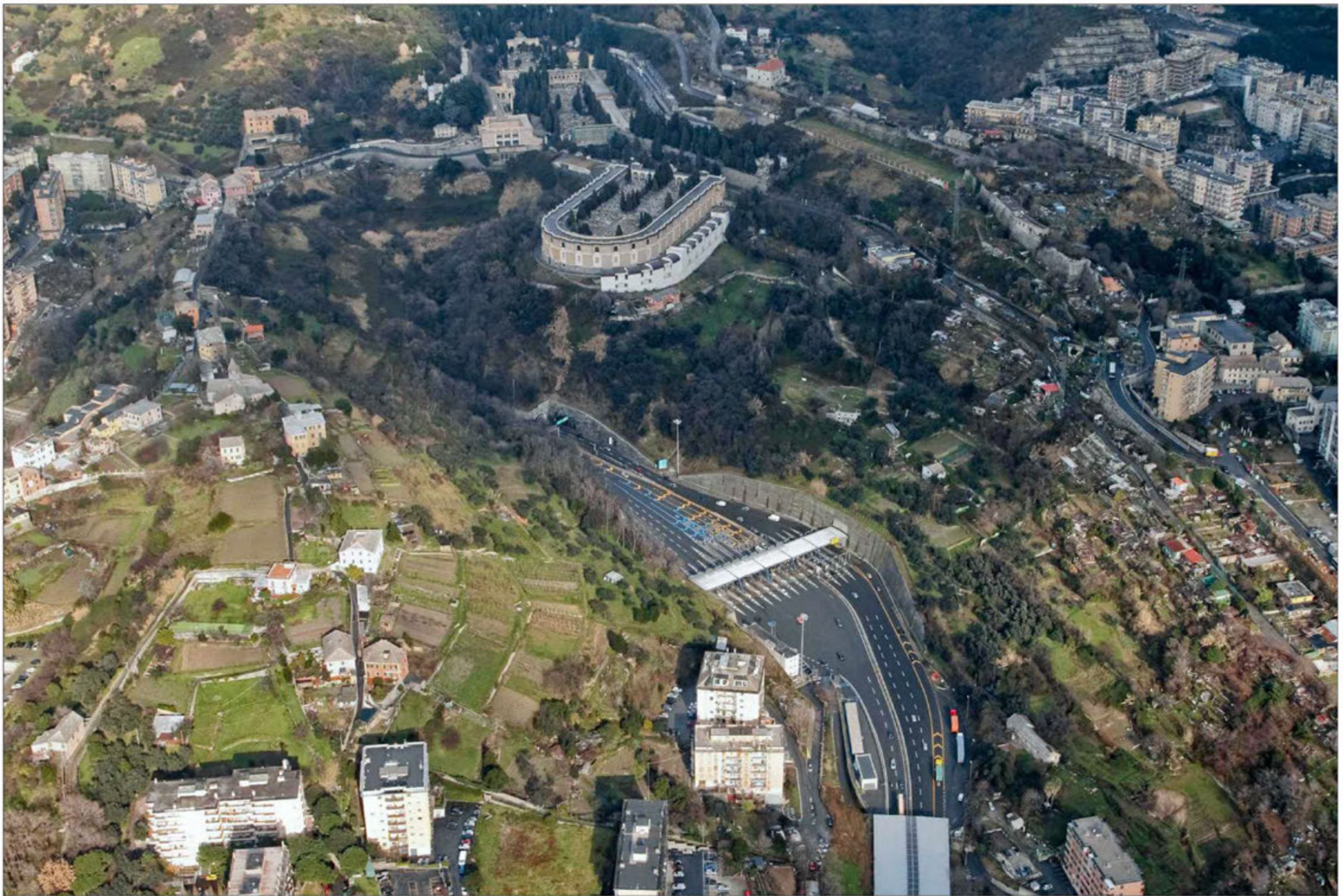
Gallerie Moro 1 - Granarolo imbocchi lato sud Stato di fatto