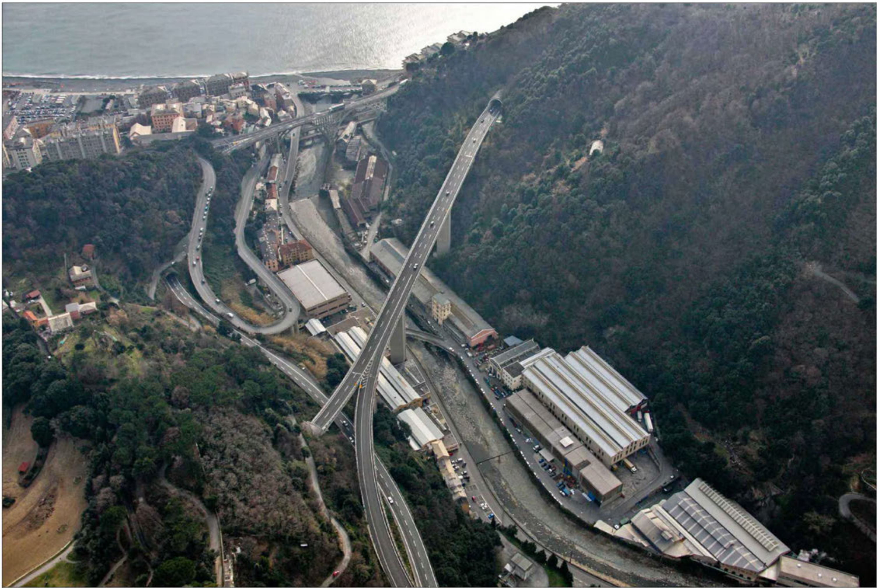
Galleria Bric del Carmo imbocco lato sud Stato di fatto