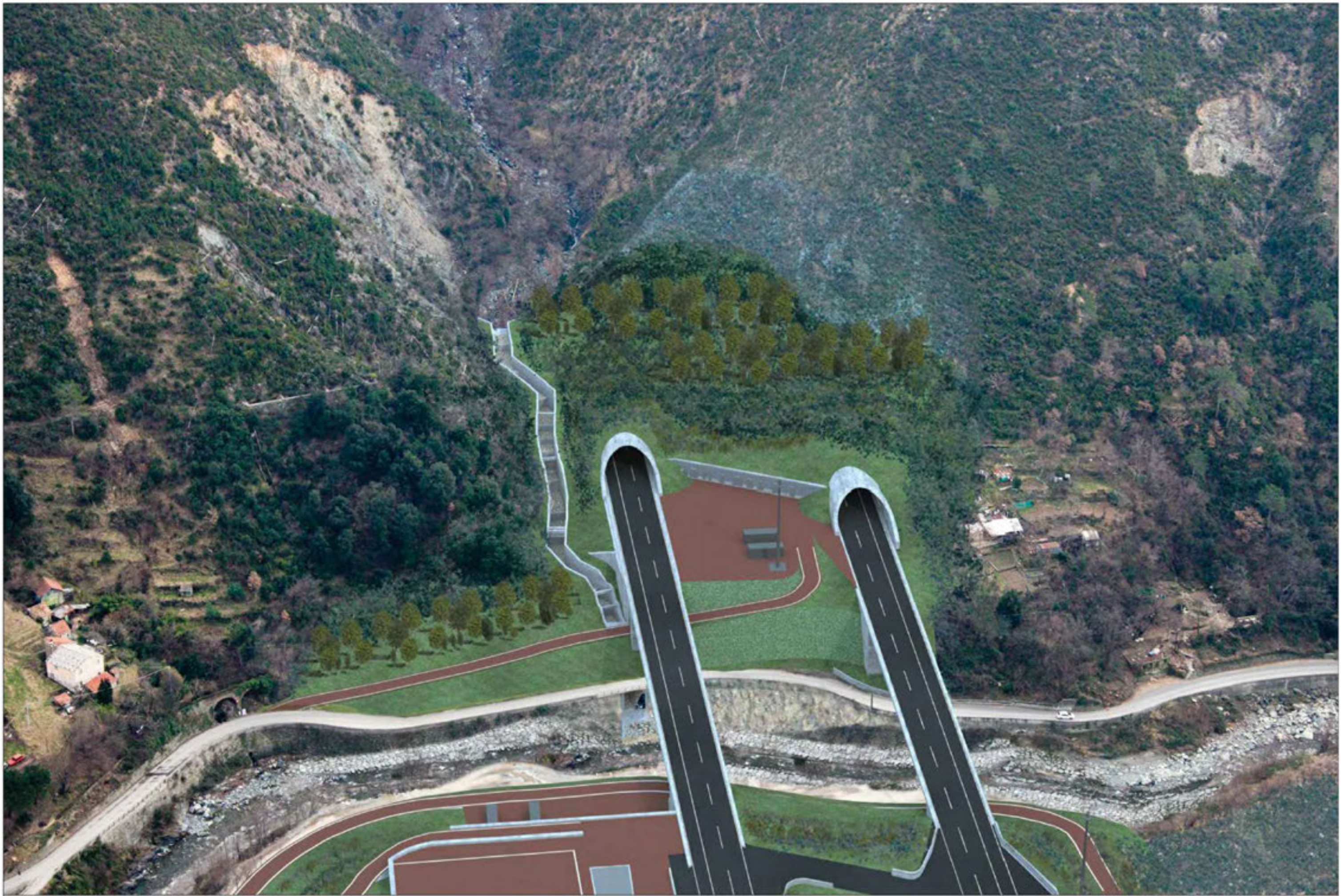
Galleria Monterosso imbocco lato Savona Crescita della vegetazione di progetto - simulazione progettuale