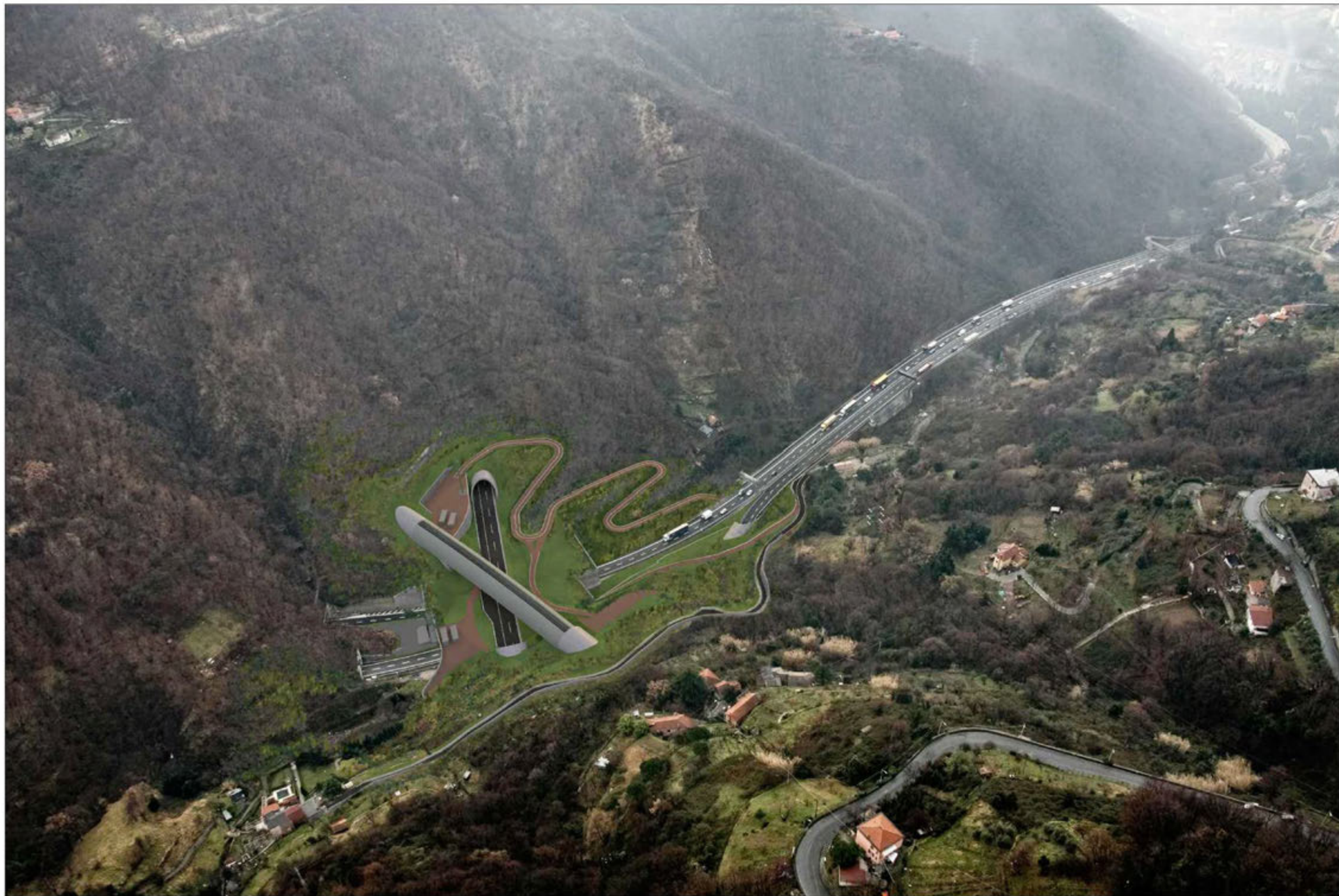
Gallerie Granarolo - Monte Sperone imbocchi lato nord Crescita della vegetazione di progetto - simulazione progettuale