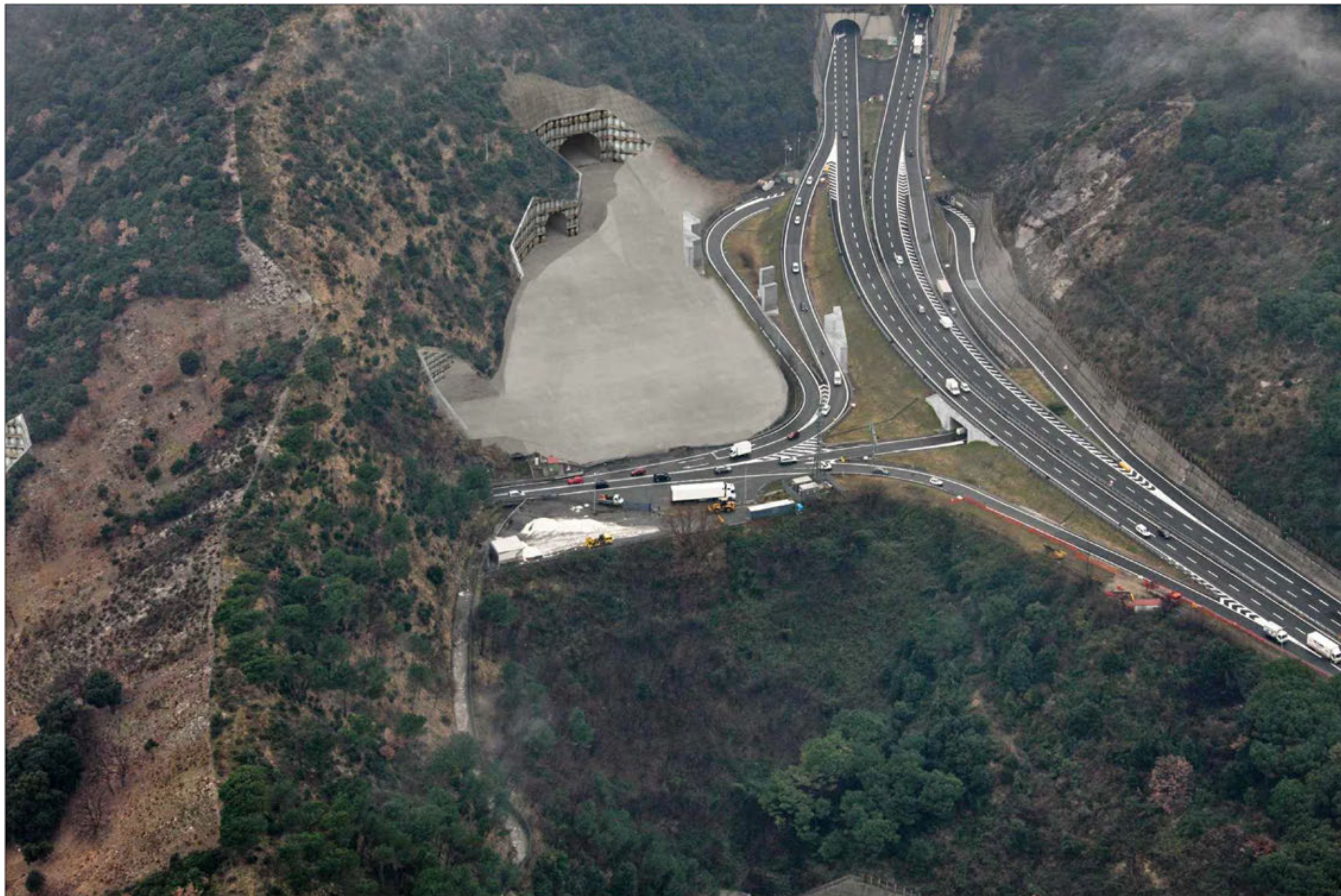
Gallerie Monte Sperone imbocco lato sud - Campursone imbocco lato nord Fase di cantiere - simulazione progettuale